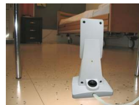
Figuur 1: Sensor Plaatsing

LET OP: Indien de Optiscan uit het los gekoppeld is geweest heeft deze ongeveer 5 minuten nodig om op te warmen en kan gedurende deze tijd niet gebruikt worden.