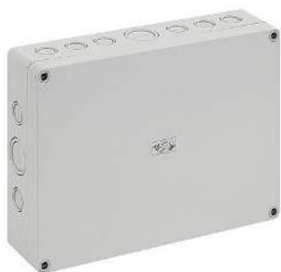
OCC | Gateway behuizing voor projectmontage

De OCC | Gateway wordt geleverd in een behuizing met de volgende specificaties: